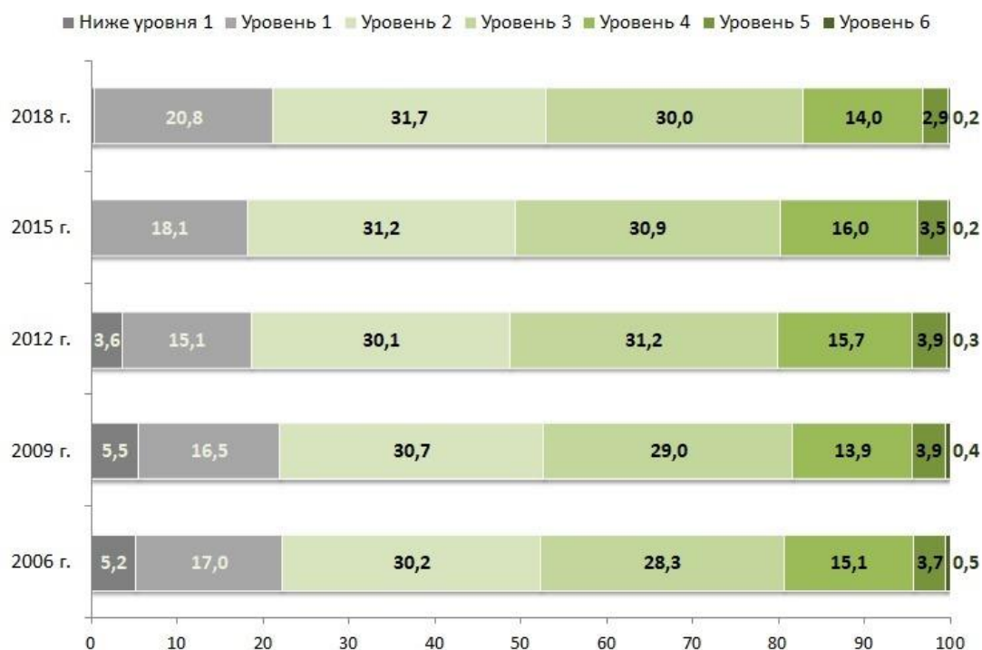
Рисунок 3. Динамика изменения распределения результатов обучающихся по уровням естественно-научной грамотности (%)

В распределении 15-летних обучающихся по уровням естественно-научной грамотности несколько увеличилось по сравнению с 2015 годом (а, точнее, вернулось к типичным для предыдущих циклов показателям) число обучающихся, не достигших порогового значения естественно-научной грамотности (2-го уровня по международной шкале) с 18 % до 21 % (Рисунок 3). При достижении данного уровня обучающиеся демонстрируют сформированность естественно-научных компетенций, позволяющих им принимать участие в различных жизненных ситуациях, связанных с естествознанием и технологиями.