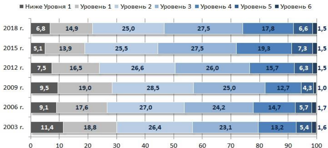
Рисунок 2. Тенденция изменения среднего балла России по математической грамотности (в %)

На Рисунке 2 представлено распределение обучающихся по уровням математической грамотности в 2003–2018 годах. В 2018 году произошло увеличение доли тех, кто получил результаты ниже порогового уровня 2 (на 2,7 %) и, соответственно, снижение доли высокоуровневых результатов на 0,7 % (уровни 4–5). Не достигли порогового уровня математической грамотности 21,7 % российских обучающихся 15-летнего возраста.